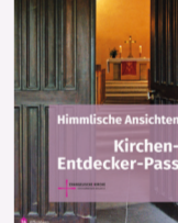
erhältlich in den regionalen Informationsstellen und in den beteiligten Kirchen